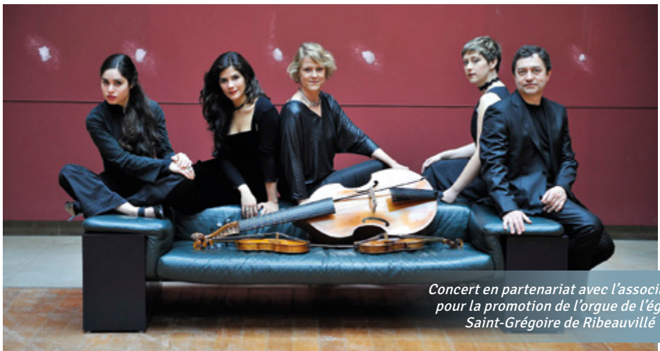
Concert en partenariat avec l'association pour la promotion de l'orgue de l'église Saint-Grégoire de Ribeauvillé

Si les circonstances rocambolesques de son voyage sont souvent citées, le contexte musical de son séjour est plus rarement évoqué: une proximité avec les milieux musicaux d'Oxford et les concerts privés qui s'y déroulaient, autour de M.Locke, C.Gibbons, T. Baltzar. Froberger aurait ainsi fait connaître aux musiciens anglais la musique de Frescobaldi et le style français de clavecin. Son influence sur l'évolution de la musique anglaise de la fin du XVII e siècle pourrait bien avoir été extrêmement déterminante.