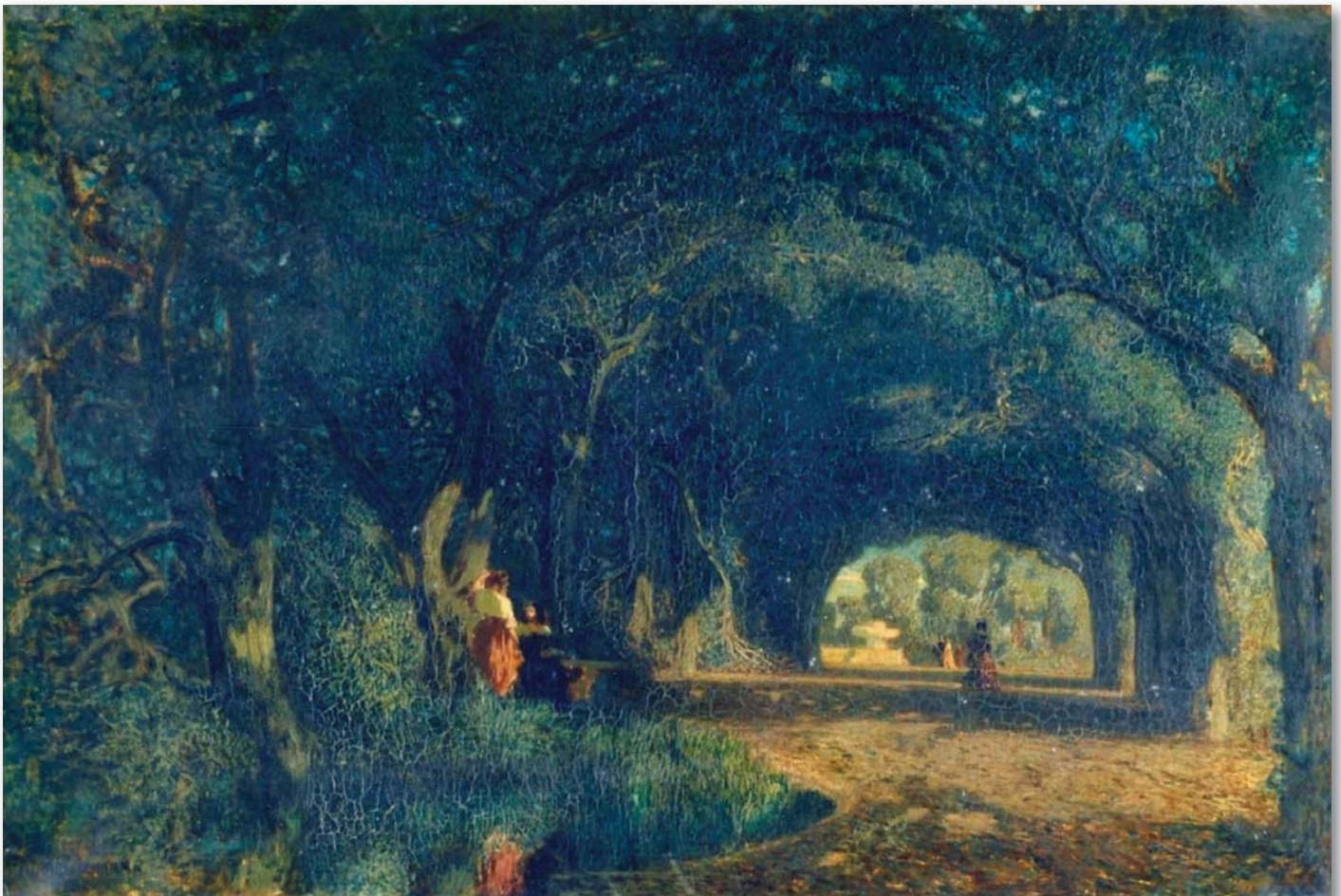
Peinture de Auguste Salzmänn représentant l'allée centrale du Herrengarten. Au fond on distingue encore une fontaine.

Fin de la 2 e partie : notre prochaine édition abordera l'histoire du Jardin de Ville du 20 e siècle jusqu'à nos jours.