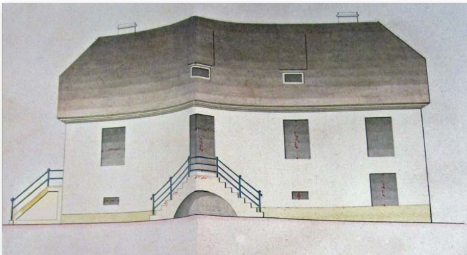
Projet d'une maison de gardiennage.

La période de la Restauration (1815 à 1830) fut l'une des plus moroses de la vie de la cité. Après la défaite de Waterloo, Ribeauvillé fut occupée par les troupes alliées. Les finances de la ville étaient totalement dégradées en raison des réquisitions, de la succession de mauvaises récoltes et de la chute du cours du bois.