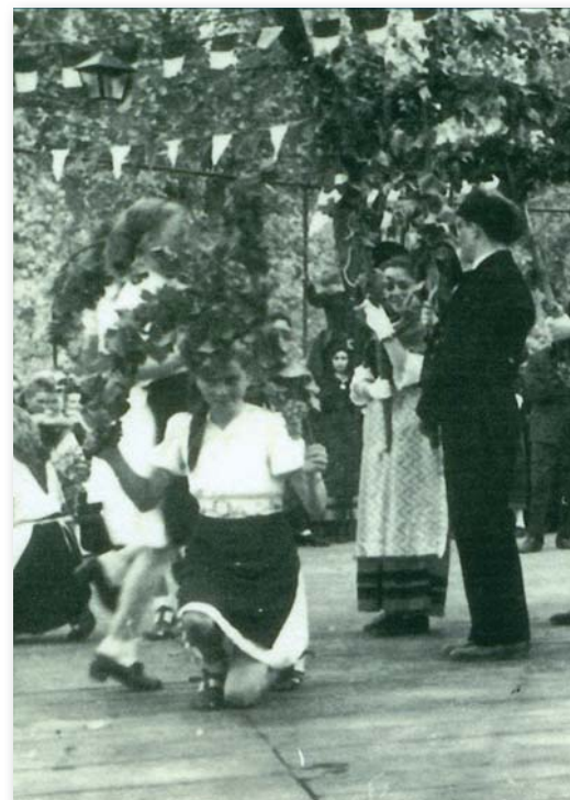
Animation folklorique dans le cadre du Pffferdaj, dans l'entre-deux guerres.

Le Herrengarten était alors un lieu de convivialité qui permettait aux familles de se retrouver dans une ambiance détendue.