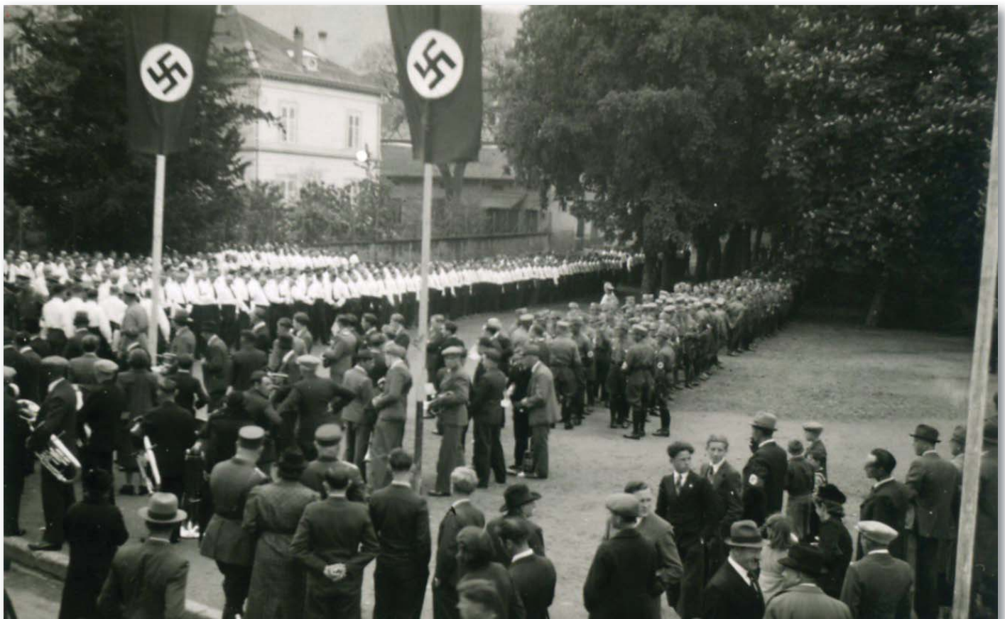
Lieu de prédilection pour les parades et les regroupements des dignitaires du régime.

D'ores et déjà de nouveaux espaces de jeux sont en place, permettant de pratiquer du mini-foot, du beach volley ou du badminton. La prégnance actuelle de la civilisation des loisirs et du sport nous engage à faire ces investissements qui répondent à une attente de notre jeunesse.