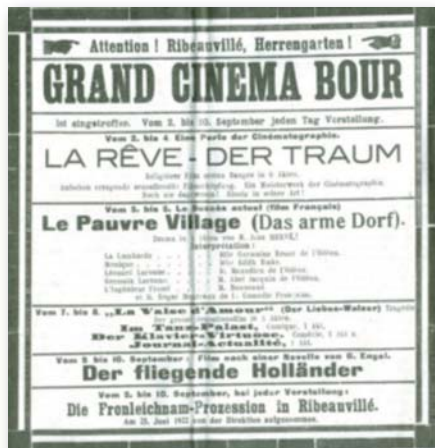
Une affiche pour un film en plein air en 1920.

Après la réunification à la France, le jardin de ville continua à être bien entretenu et les animations musicales allaient alterner avec les autres manifestations festives (Pffferdaj, défilés des gymnastes et même un premier cinéma en plein air....).