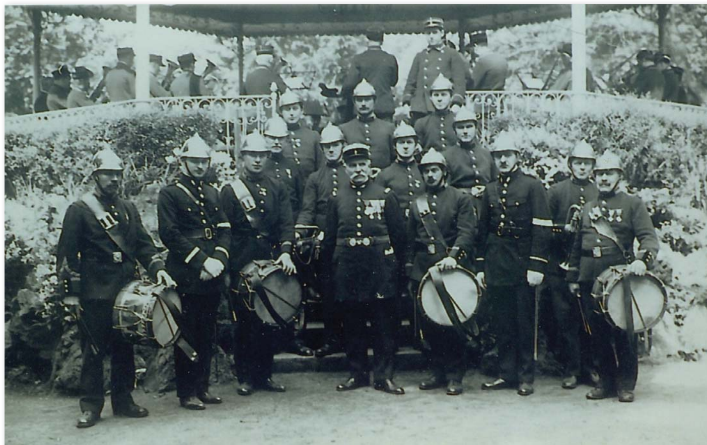
Les associations locales affectionnent particulièrement le kiosque du jardin de ville pour leur photo de groupe.

(650 marks). Les autres mécènes furent des associations locales, dont les trois sociétés de musique de Ribeauvillé qui contribueront à la hauteur de 150 marks chacune.