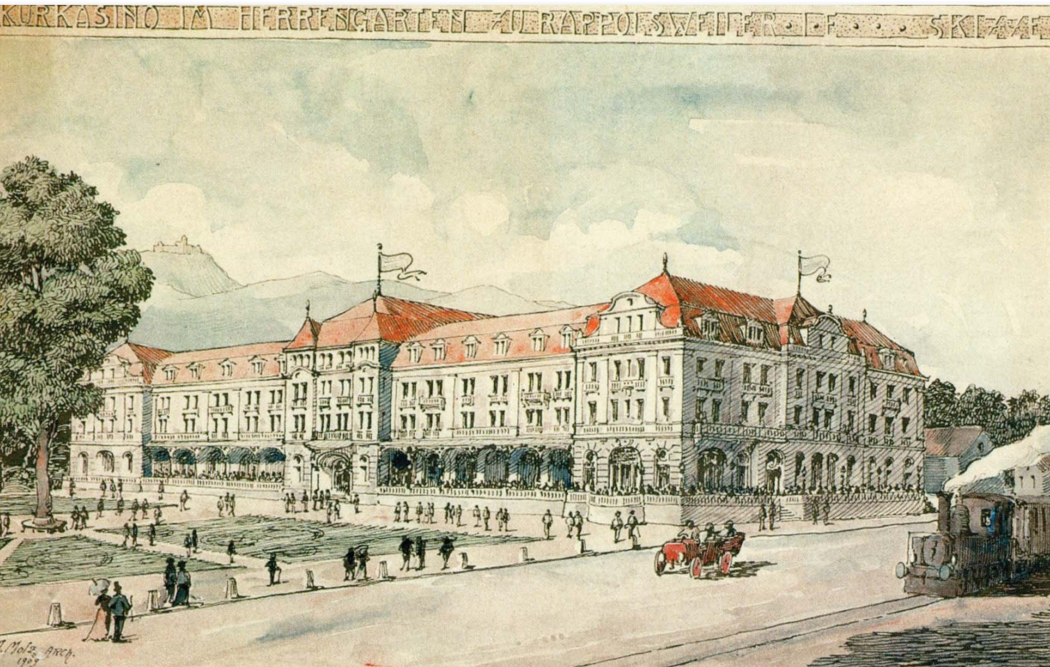
Le projet de casino en limite est du jardin de ville est abandonné lorsqu'éclate la guerre en 1914.

Proche de la gare du tramway, le Herrengarten était également la vitrine de la ville pour les visiteurs.