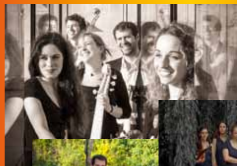
← L'Achéron (c) (Adrien Touche)