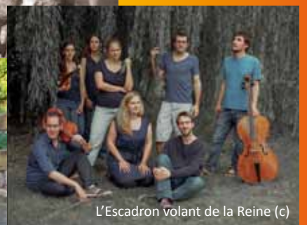
L'Escadron volant de la Reine (c)

Renseignements et réservations à la Mairie de Ribeauvillé au 03 89 73 20 00 ou sur le site du Festival :