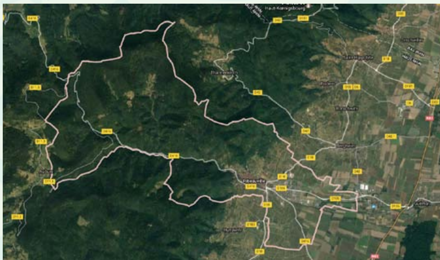
Vue aérienne Google Maps, ban communal de Ribeauvillé.

Il sera renouvelé en 2017 sous la nouvelle appellation « station classée de tourisme », en attente de l'arrêté ministériel.