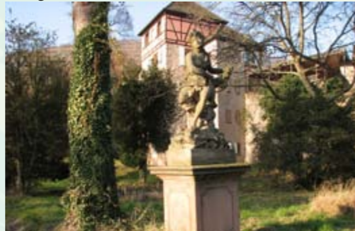
Jardin seigneurial classé jardin remarquable par le Ministère de la Culture