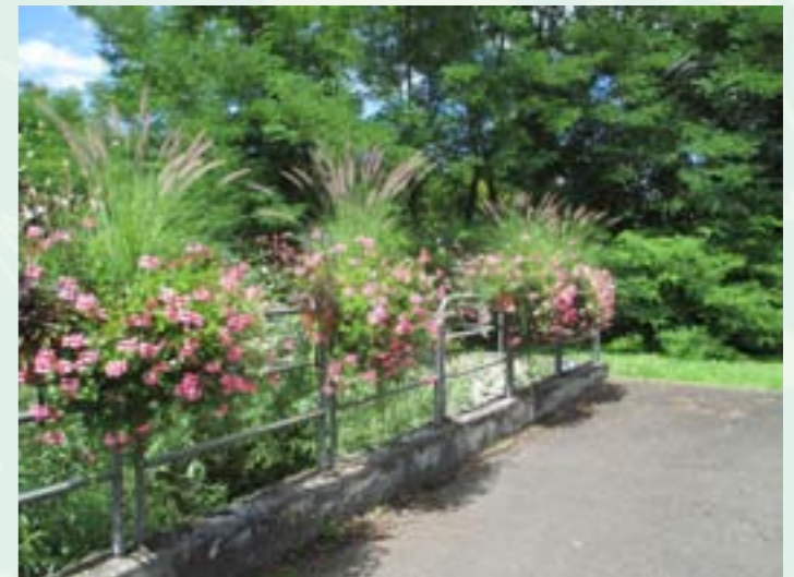
Déversoir d'orage, entrée de ville