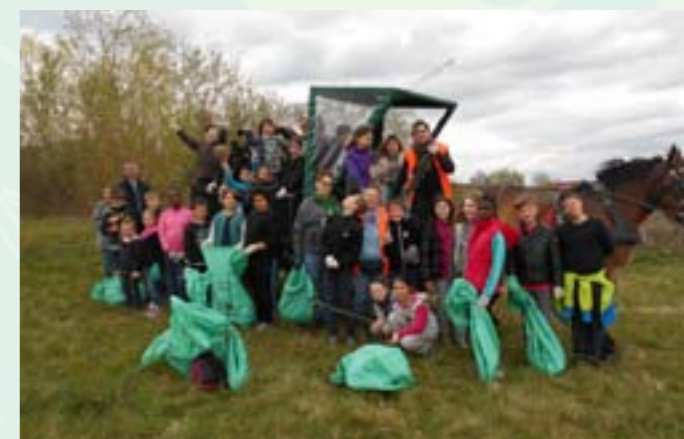
Opération Haut-Rhin propre.

Des campagnes «Toutounet» sont menées par le Conseil Municipal des Enfants avec des rappels réguliers dans la revue municipale.