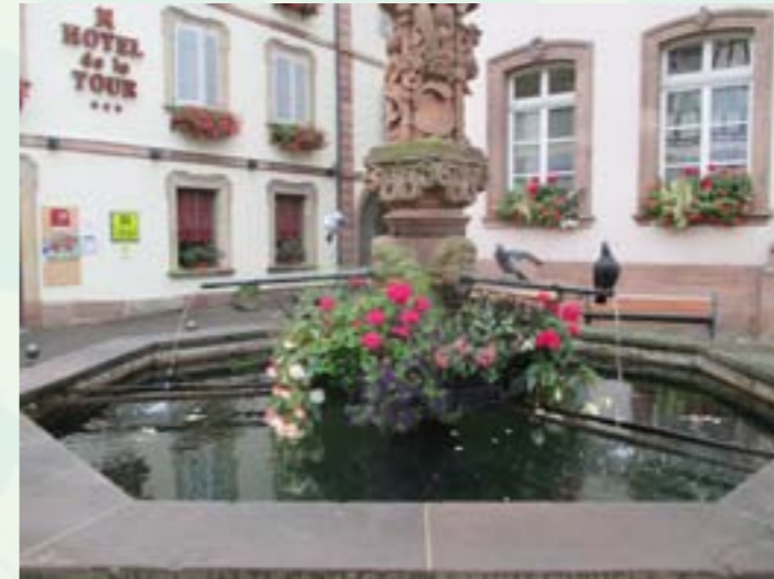
Fontaine de l'Hôtel de Ville