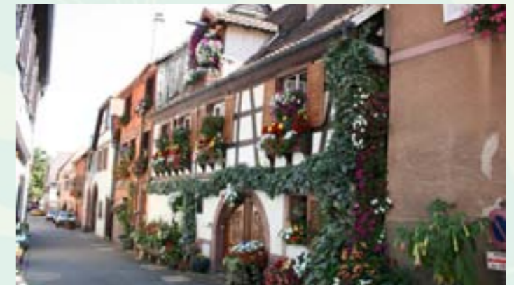
Candidature ADT régulière pour Maisons fleuries des particuliers en sélection départementale