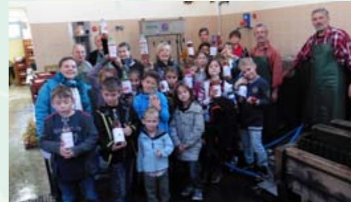
Animations et formations « permaculture » ; taille des arbres, pressage jus de pomme