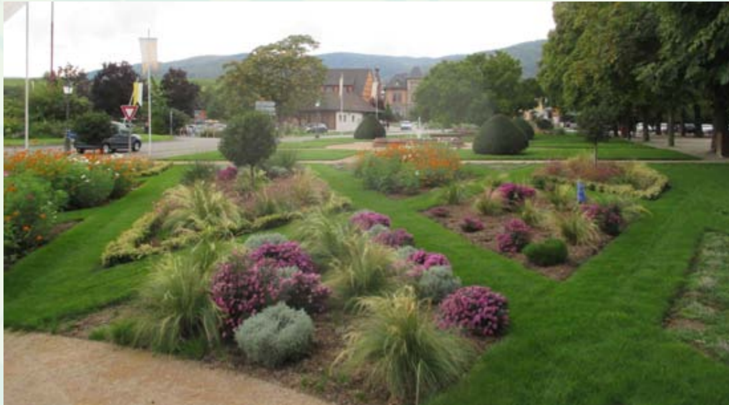
1/ Jardin de ville, massifs en mosaïque