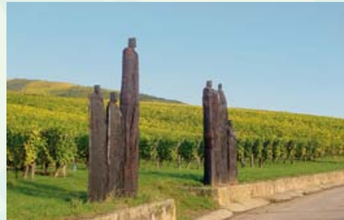
Le Clos Zahnacker

La vigne, implantée depuis le Moyen Âge, permet aux nombreux viticulteurs ainsi qu'à la Cave Coopérative de proposer des visites avec dégustation. La ville compte 3 grands crus : Geisberg, Kirchberg de Ribeauvillé et Osterberg ainsi qu'un terroir unique qui a traversé les siècles, le Clos Zahnacker en vignes complantées.