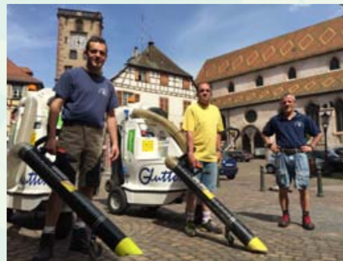
L'équipe Propreté du service «4 fleurs»

Le service « 4 fleurs » est constitué autour des équipes