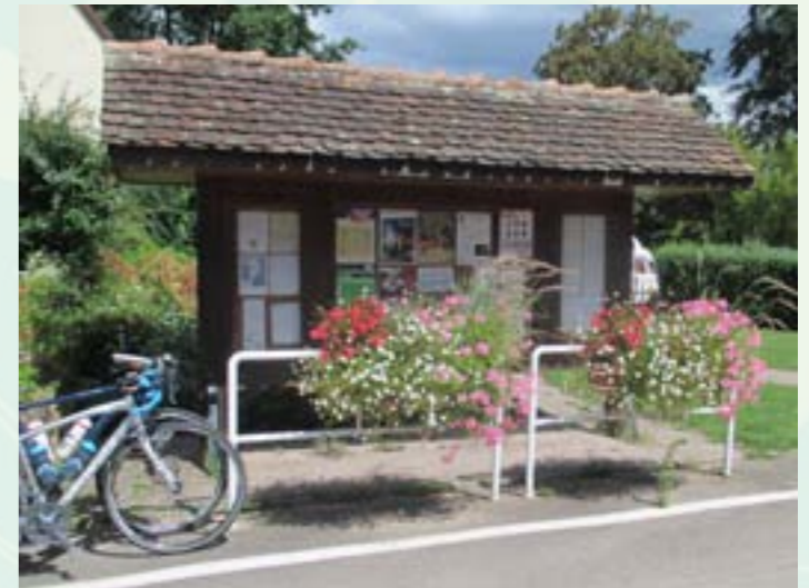
Camping **** Pierre de Coubertin