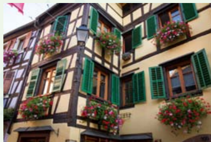
Dispositif de subvention des façades