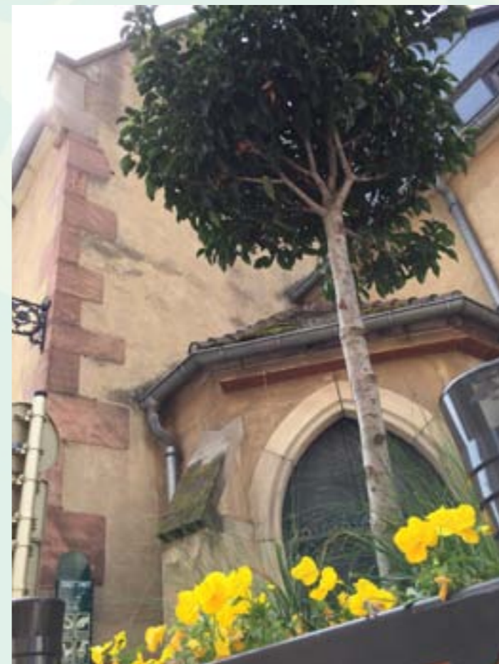
5/ Ville haute, nouvelles jardinières