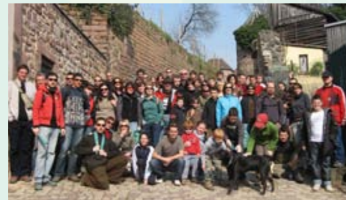
Journée d'entretien des châteaux et des Verreries par des associations locales