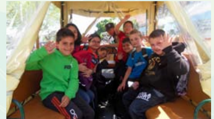
Promenades touristiques en calèches pour les enfants des écoles et les personnes âgées