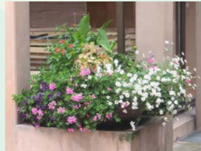
Salle du Théâtre