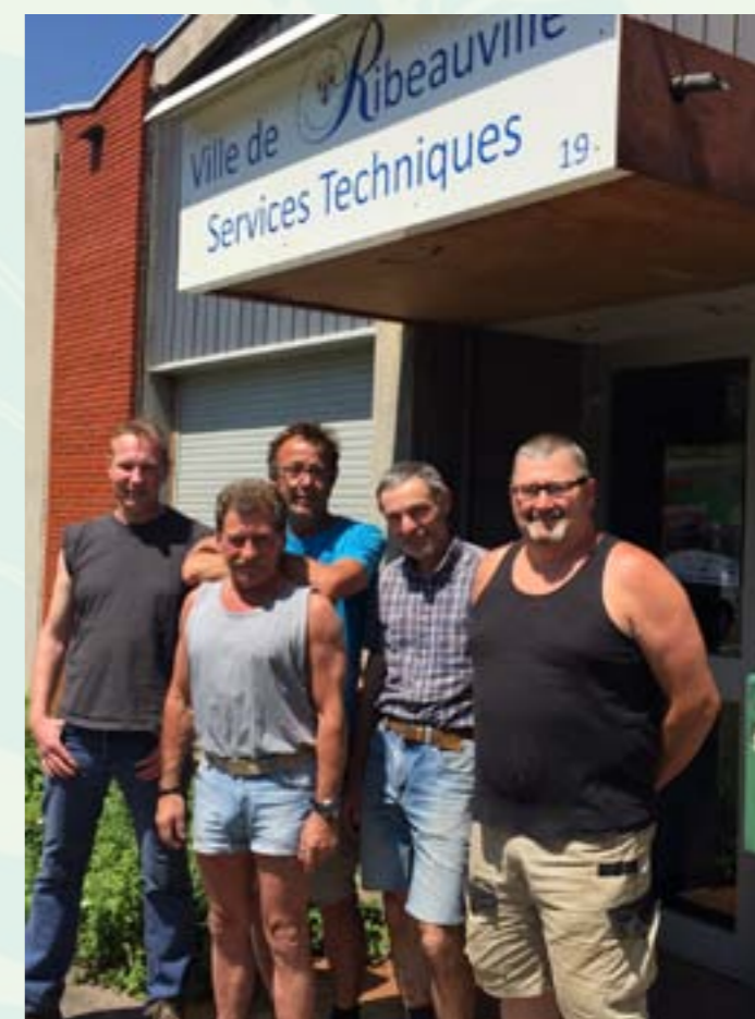
L'équipe Espaces Verts du service «4 fleurs»

Le travail des agents en régie municipale représente 7 455 heures en 2016.