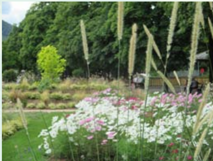
Jardin de Ville

Pour ce qui est des jardinières, nous nous orientons vers la définition de thématiques de fleurissement afin d'objectiver nos critères d'évaluations.... et aussi pour s'amuser à imaginer de nouvelles compositions. En 2017 par exemple, nous expérimentons l'installation de jardinières et bacs gourmands, pourvoyeur d'aromates, de fleurs et de fruits.