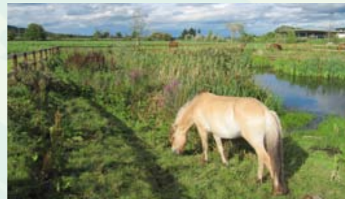
Création de la mare pédagogique vers le centre équestre en 2014 et aménagements définitifs en 2016 avec édition d'un fascicule biodiversité et organisation d'animations régulières