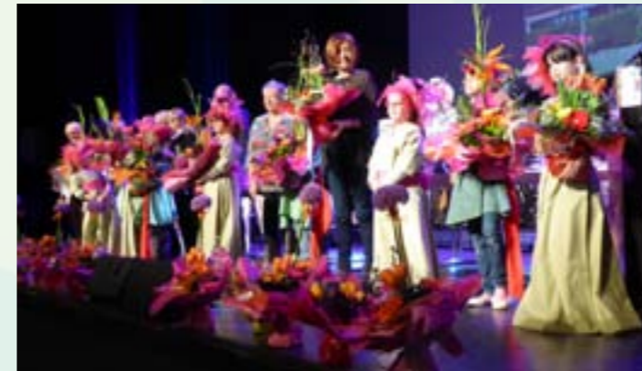
Concours des Maisons Fleuries