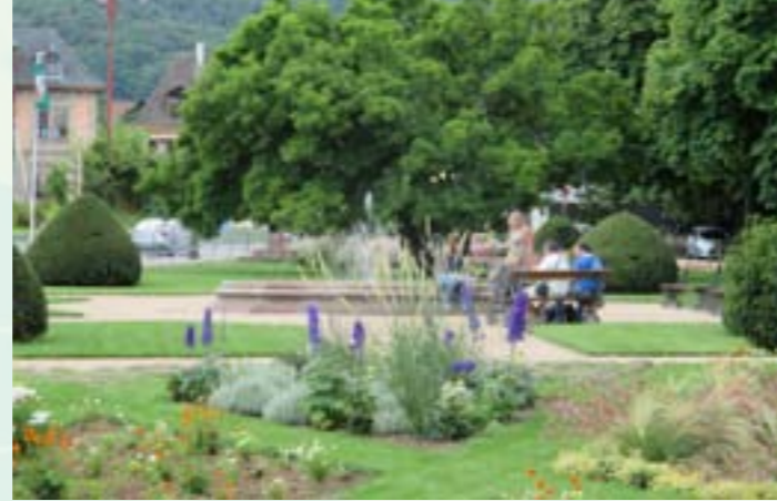
Jardin de ville