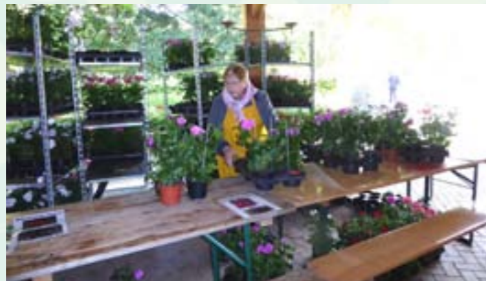
Action « Fleurir la cité » depuis 2009 (cadeau de 4 plants à chaque habitant de la cité