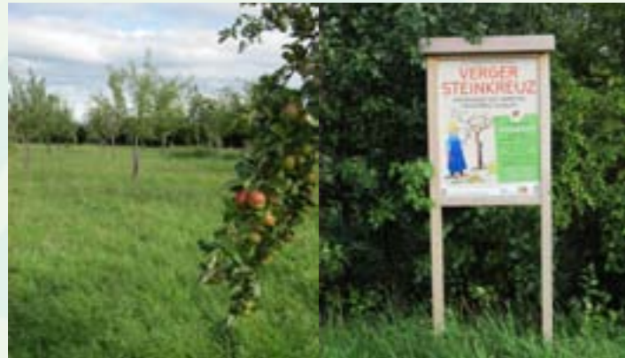
Verger école depuis 2000