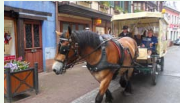
Cheval en ville depuis 2012