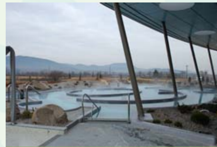
La Balnéo du Casino Barrière

En partenariat avec la Communauté de Communes du Pays de Ribeauvillé, la Ville a développé un ambitieux projet de complexe touristique alliant casino, hôtellerie et thermalisme sur une zone située à l'est de la commune. Le Casino est exploité par le groupe BARRIERE depuis 2005 (167 machines à sous à ce jour). Le complexe thermal est ouvert depuis 2012 et rencontre un vif succès.