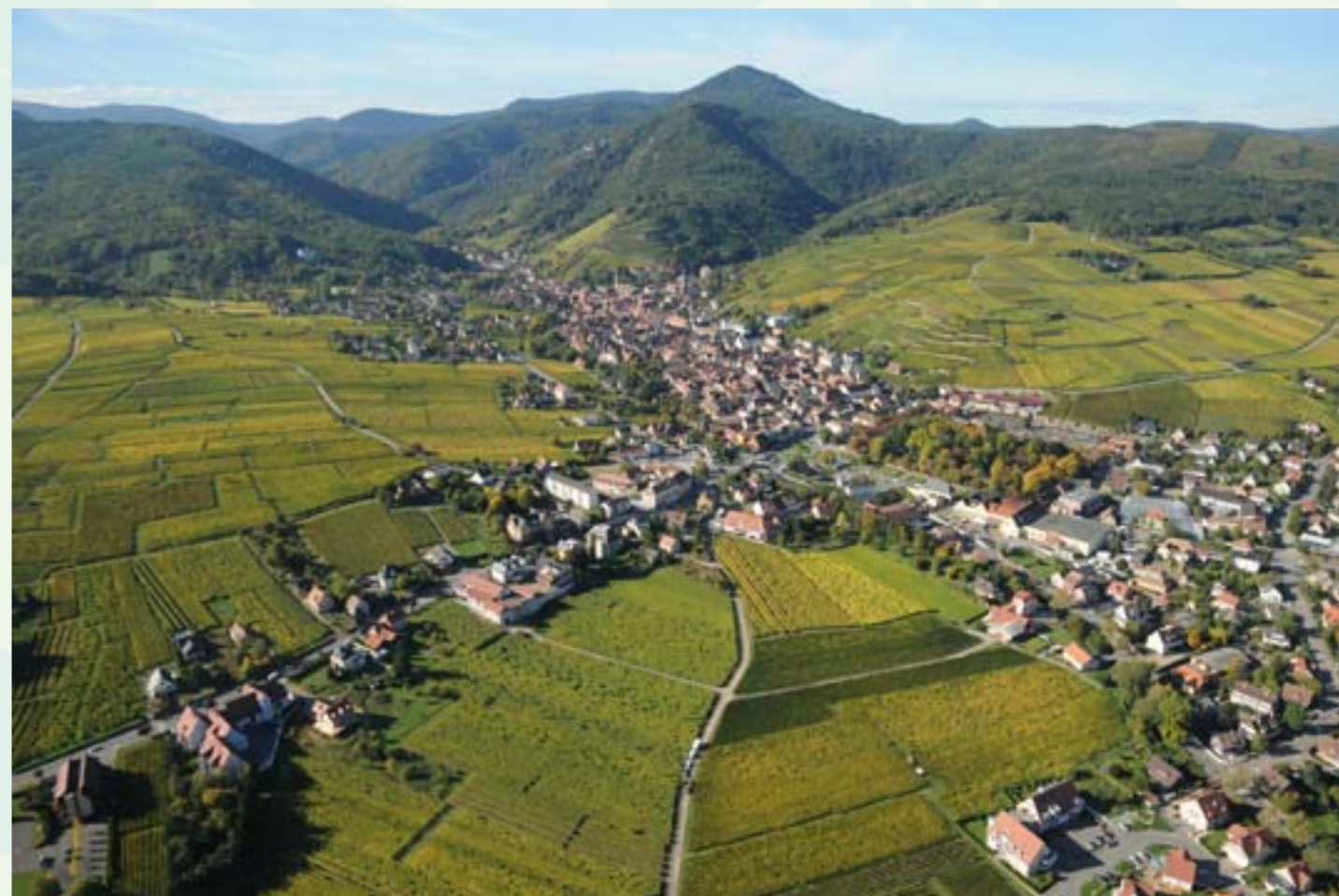
Vue aérienne de Ribeauvillé