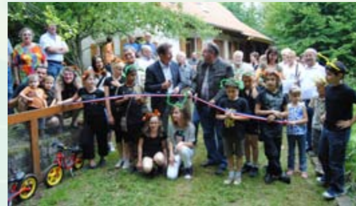
Rucher école depuis 2011