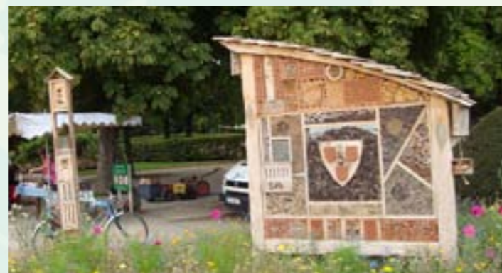
Hotels à insectes avec panneau pédagogique