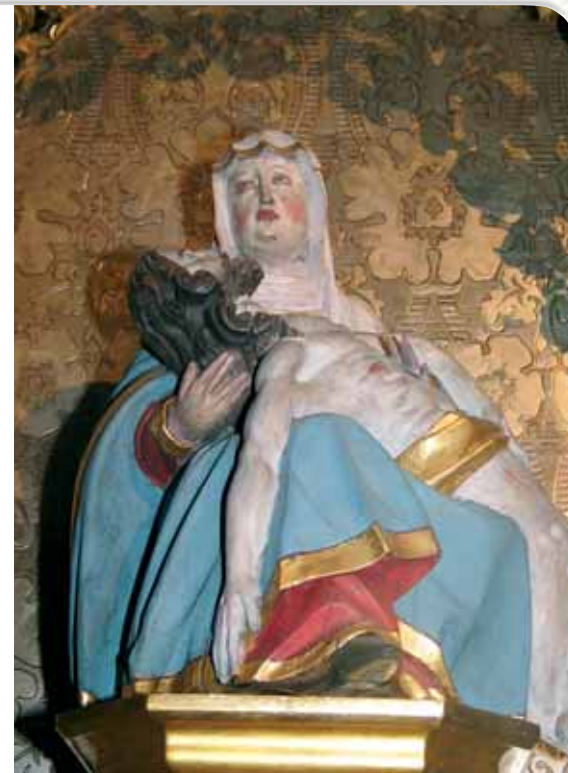
1498 : La Vierge de Dusenbach (chapelle des Grâces) Pour marquer la première destination du lieu, consacré à la dévotion à Marie, Maximin II fait ériger une Piéta (Vesperbild), vraisemblablement exécutée par le sculpteur Lorentz, bourgeois de Ribeauvillé. Elle devient la statue vénérée au Dusenbach.

2004-12 avril : Commémoration du centenaire de la présence des Capucins à Notre-Dame de Dusenbach.