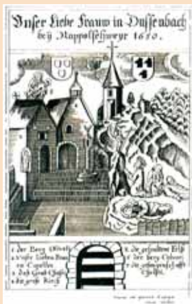
1650 : date de la gravure la plus ancienne connue actuellement (artiste anonyme).

1632 : Le sanctuaire est ravagé par les troupes suédoises lors de la Guerre de 30 ans. Il sera restauré en 1656.