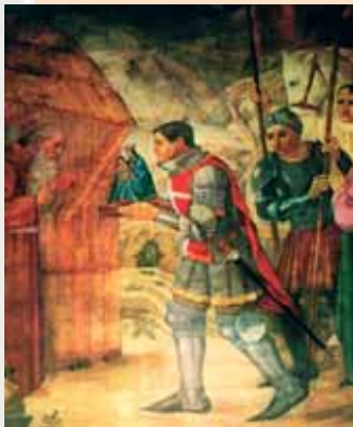
Eguenolphe de Ribeaupierre de retour de croisade - peinture de Talenti, chapelle des Grâces

1221 : d'après la tradition, la fondation du pèlerinage se rattache à une statue de la Vierge que Eguenolphe II de Ribeaupierre rapporte de la Ve Croisade, expédition particulièrement meurtrière. C'est probablement pour remercier Dieu des dangers auxquels il a