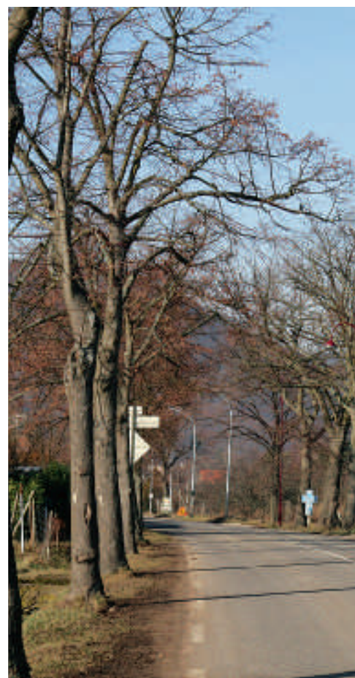
L'entrée de ville route de Guémar avant travaux

Il est amusant de relever qu'au début du 20 ème siècle cette route de Guémar était déjà considérée comme dangereuse et encombrée. En effet, sur le même axe circulaient un tram, des charrettes attelées, les premières automobiles et nombre de «marikkutschas».