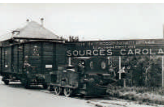
La route de Guémar en 1928

Le conseil municipal s'est engagé à embellir et sécuriser toutes les entrées de la ville dans les années à venir. Après les travaux entrepris avenue du Général de Gaule en 2003, c'est au tour de l'entrée Est de faire l'objet d'importants travaux de voirie.