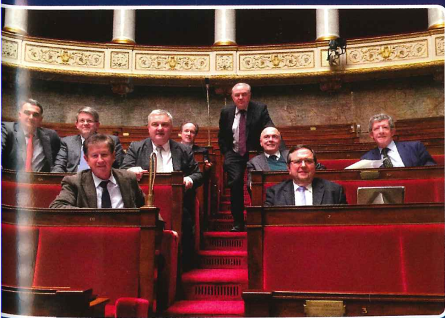
Les députés alsaciens dans l'hémicycle