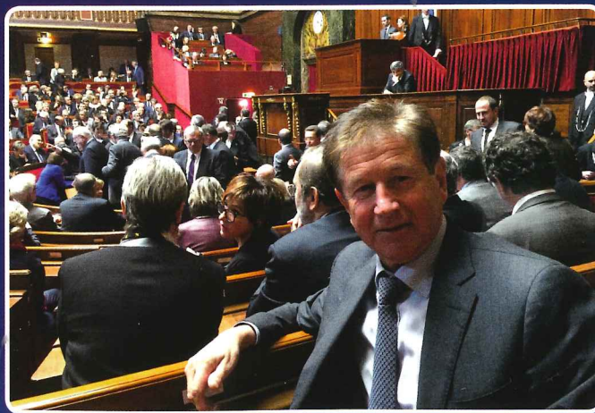
Au Congrès de Versailles fin 2015