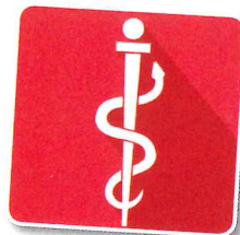
Les professions médicales