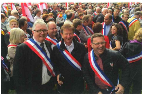
Manifestation contre le projet de création de la grande région