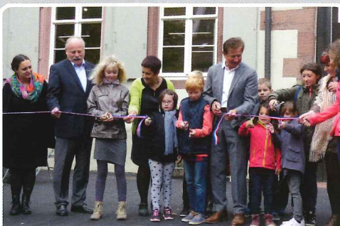
Inauguration de la médiathèque de Ribeauvillé