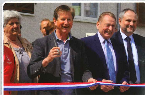
Réhabilitation d'un immeuble Habitat de Haute-Alsace.