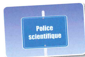
La police scientifique