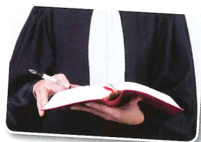
Les professions du droit