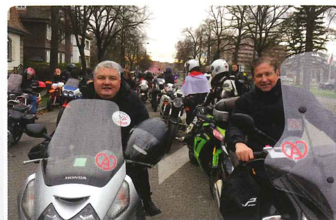
Manifestation contre le projet de dissolution de l'Alsace dans la grande région