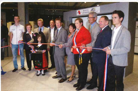
Inauguration des travaux d'extension de l'entreprise MOOS à Bergholtz-Zell