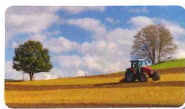
Les professions agricoles