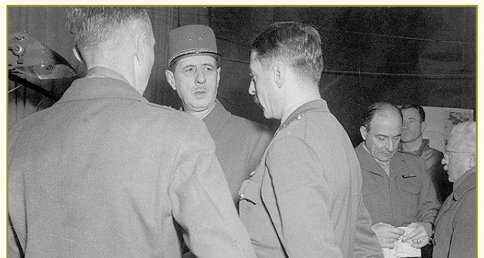
Visite du Général de Gaulle à l'état-major installé à l'hôtel Bellevue. A l'arrière, le Général de Lattre, à sa droite, le Général de Montsabert

Les Français arrivent le 6 décembre et l'état-major s'installe au Couvent. Durant les combats de la Poche de Colmar, l'état-major prend ses quartiers à l'Hôtel Bellevue (château Amritabha actuel) pendant environ trois mois.