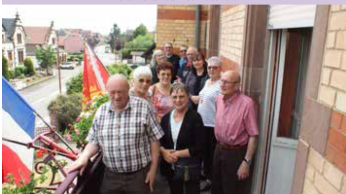
Visite des Archives Municipales et du Cercle de Recherches Historiques