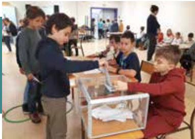
À l'école élémentaire du Rotenberg

Suite à l'explication du fonctionnement du Conseil Municipal des Enfants dans les écoles élémentaires, les déclarations de candidatures ont abouti aux opérations de vote en octobre ! Une véritable leçon d'instruction civique !