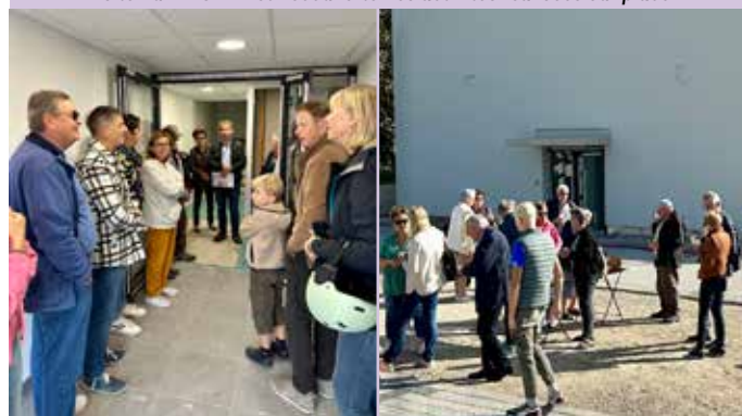
Visite du chantier de la nouvelle Gendarmerie avec le Conseil Municipal en 2023