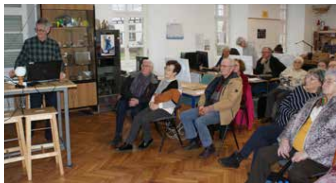
Visite du RIBOLAB et découverte des activités réalisées sur place