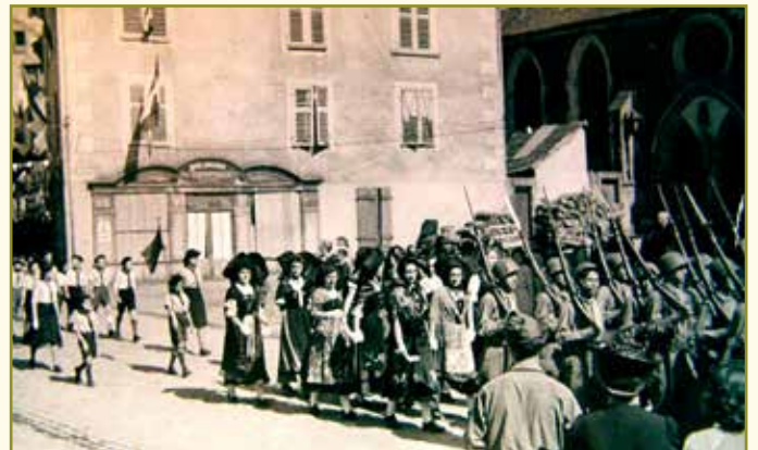
Une des multiples manifestations qui ont suivi la libération

Entre décembre 1944 et décembre 1945, un grand nombre d'unités américaine française et même canadiennes ont été cantonnées : près de 7 à 8000 (par roulement) officiers, sous-officiers et hommes de troupe.