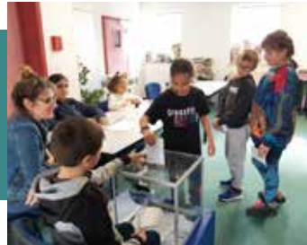
À l'école élémentaire Sainte-Marie