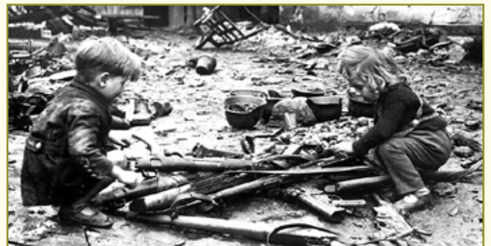
Enfants jouant avec des armes laissées par l'armée allemande lors de sa retraite

À l'issue de la guerre, des anciens prisonniers de guerre allemands ont également travaillé à Ribeauvillé : 37 dans l'agriculture, 20 bûcherons, 15 comme démineurs, 13 comme journaliers, 4 comme manœuvres, 4 chez un menuisier, 3 chez un tonnelier, 1 chez un peintre, 3 chez un maçon, 1 chez un plâtrier, 1 chez un sellier, 2 comme manœuvres, 3 chez un boulanger, 1 comme tourneur sur bois.