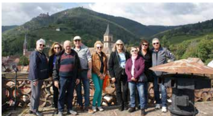
Visite de la Tour des Bouchers

En attendant, l'ensemble des membres du Conseil des Aînés souhaite de bonnes fêtes de fin d'année à tous les habitants de Ribeauvillé !