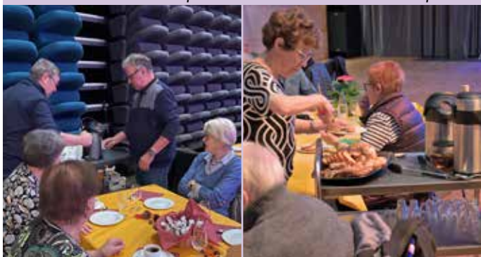
Service lors des goûters de printemps et d'automne organisés au Parc