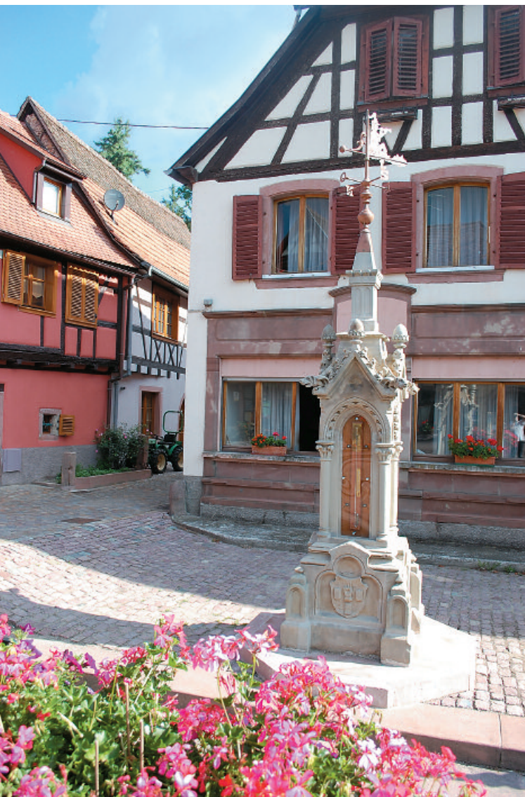
2009 - Place du Bouc

Lors du projet de rénovation de la place de la République, les architectes se sont rendu compte que la station constituait une entrave au nouveau plan de circulation sur cette place. Le Conseil a alors délibéré pour trouver un nouvel emplacement. Un consensus s'est dégagé pour la place du Bouc. La colonne a été nettoyée et restaurée par l'entreprise Scherberich de Colmar. Elle a été mise en place en mai 2009 à la satisfaction générale des habitants de la Ville Haute et des touristes de passage.