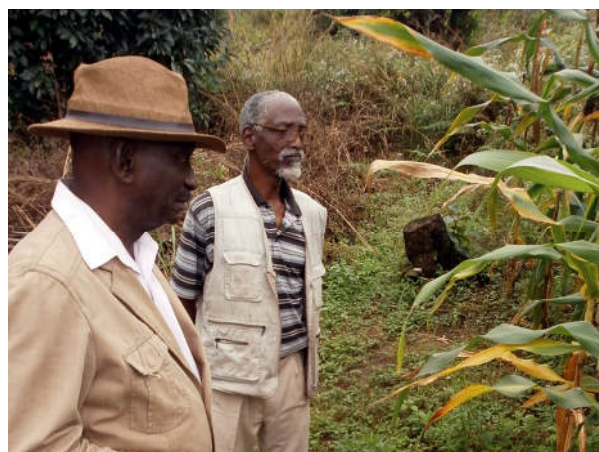
Visite du Président du CDP sur la parfelle de production de semence à Kiazhi