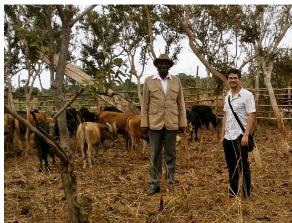
Mission du Président du CDP et du Chef de projet PROFAP au parc de quarantaine, avant distribution des bovins

Ces évolutions favorables ont conduit à programmer la mission d'échanges, institutionnelle et stratégique, d'une délégation issue du CDP en Alsace en 2016.