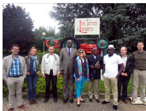
Photos de groupe après la rencontre à Strasbourg de la Vice-Présidente de la Chambre d'agriculture et de la délégation CDP