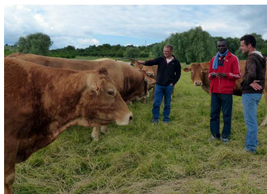
Le Chef de projet Adjoint lors de sa mission en Alsace en 2014, en visite sur un élevage bovin

Depuis 2013, le Ministère de l'Agriculture et de l'Élevage met à disposition du PROFAP un ingénieur de développement rural affecté au PROFAP, qui assure la fonction de Chef de projet adjoint (CPA). Il devra prendre la tête de la future structure agricole du CDP en charge de la coordination des activités de terrain . Le CPA, qui a effectué une mission d'apprentissage et d'échange en Alsace, a ensuite été formé en continu tout au long du projet, via une responsabilisation dans les différentes activités : mise en œuvre, suivi, évaluation, coordination. Il tire de son travail de terrain des pistes de réflexion et d'action permettant d'alimenter la stratégie agricole du CDP.