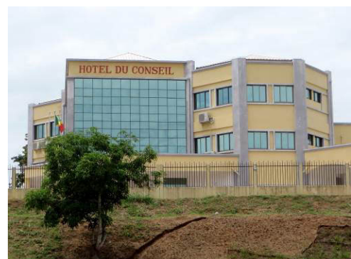
Le Conseil Départemental du Pool

Le Conseil départemental du Pool est une collectivité relativement jeune , issue du processus de décentralisation engagé au Congo à partir de 2003 . La coopération décentralisée entre la Ville de Ribeauvillé, l'Ircod et le CDP a pour enjeu prioritaire l'appui à la structuration de cette nouvelle entité, autour de priorités de développement identifiées sur le territoire. L'objectif du PROFAP est de