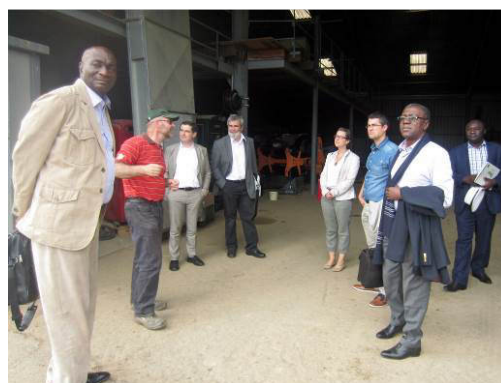
Délégation du CDP en Alsace / visite de l'exploitation agricole du Lycée d'Obenai

Enfin, les missions d'échanges organisées dans le cadre du projet permettent de générer des analyses et des orientations sur des axes thématiques spécifiques. Citons en particulier la mission en Alsace du Président du CDP, de son conseiller économique et du Secrétaire Général du CDP, qui leur a permis d' appréhender le modèle français sur la question de la structuration du monde agricole et du rôle des collectivités dans le développement rural . A l'issue de cette mission, le CDP a fait savoir sa volonté de mettre en place en son sein une structure chargée de coordonner les activités de terrain en lien avec le secteur agricole découlant de son plan stratégique. Il souhaite également accompagner la création d'une Chambre d'agriculture ou d'une structure équivalente, inspirée du modèle français, gérée par les professionnels du secteur avec pour objectif d'accompagner les agriculteurs dans le développement de leur activité sur les plans technique, commercial ou de gestion.