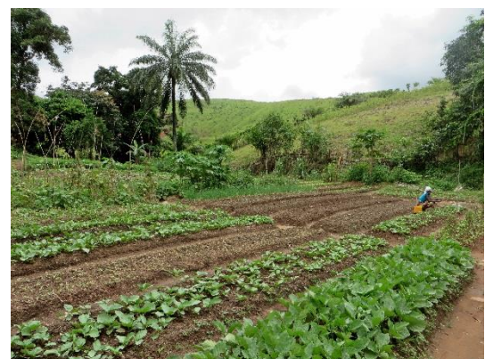
Parcelle maraîchère de la Ferme pilote de Mindouli

Dans le cadre du PROFAP, 6 fermes dites pilotes, qui sont des exploitations agricoles gérées par un groupement à caractère familial dont les membres ont la motivation de s'investir dans le développement de leur exploitation mais également de leur territoire . Ces fermes se démarquent par leurs infrastructures et leurs ressources humaines, et pratiquent au moins l'une des activités concernées par