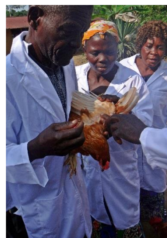
Formation pratique des éleveurs avicoles