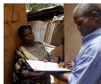
Formation des animateurs paysans : présentation et utilisation des fiches de suivi