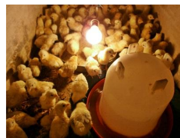
Production et pré-élevage des poussins