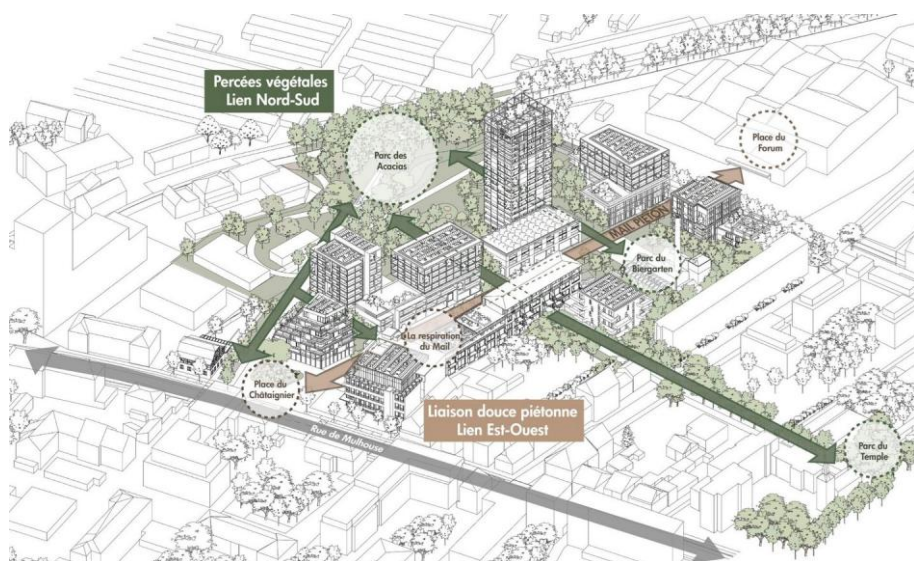
Figure ci-contre, Sortons du Bois paysagistes Projet Quartier des Lumières Saint-Louis

https://sortonsdubois.fr/projets/quartier-les-lumieres/